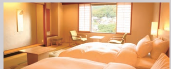
和室スーペリアツイン(庭側)