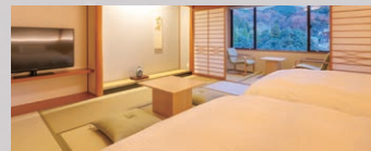
和室スーペリアツイン(山側)