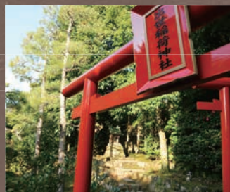
出世稲荷神社分祀