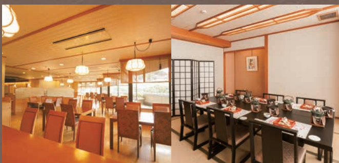
■3F 料理茶屋 燕楽